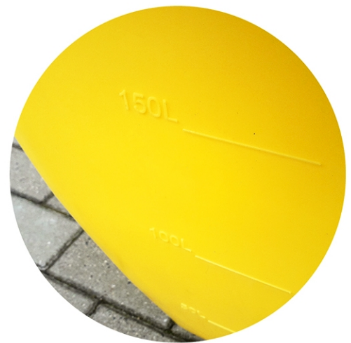
Escala de graduación