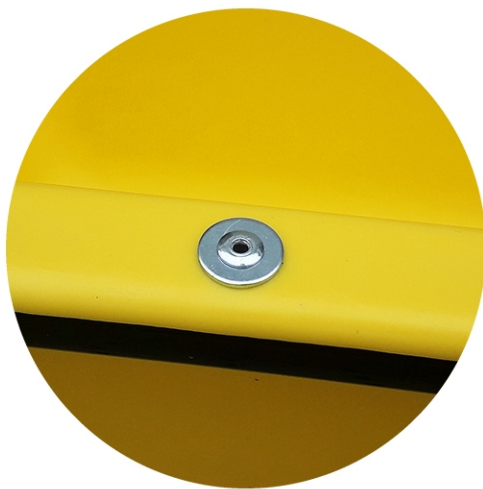
Refuerzo perimetral con aro metálico