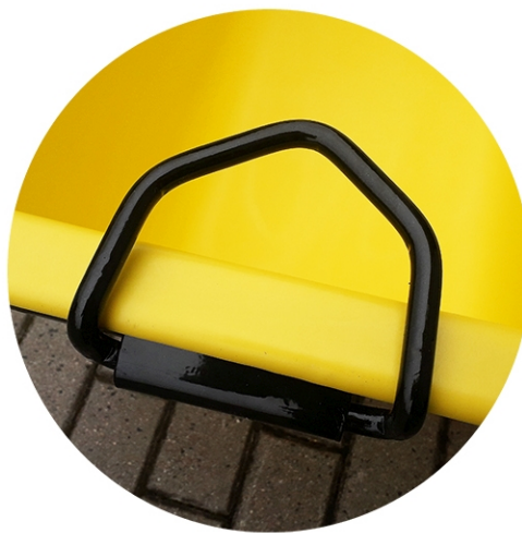
Manillas de levantamiento sólidas